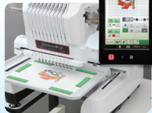
マイデザインセンターキット 50,000円