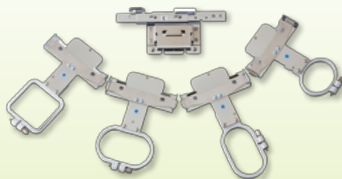
ネーム枠キット・マグネット枠 筒物用枠張りジグ 61,000円