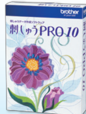
刺しゅうPRO オープン価格