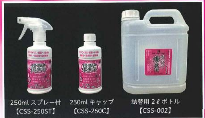
250ml スプレー付 【CSS-250ST】